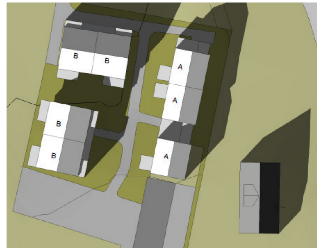
Sol- og skygge 21. mars kl.15.00

Kvalitativt uteareal, skravert: ca. 730 m 2 Balkonger 2 plan: 70 m 2 TOTALT: 800 m 2